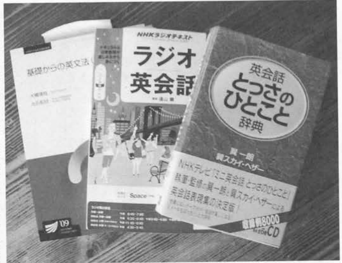
「英会話とつさのひとこと辞典」DHC 「ラジオ英会話 2013年6月号」NHK出版 「基礎からの英文法 (09)」放送大学教育振興会

「英会話を学んでも覚えられない」とか「英会話を学ぶにはお金がかかる」とか思っていないませんか？ 当クラブでは、こういった問題を解決した学習方法を行っているので、少し紹介したいと思います。